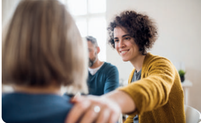
Eine aktive Zukunftsgestaltung ermöglichen