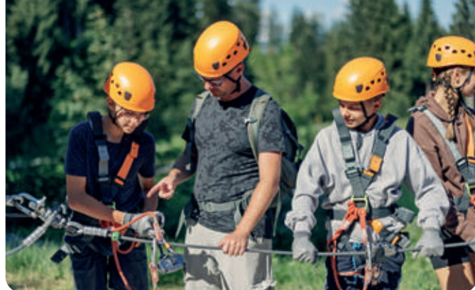
Bei erlebnisorientierten Aktivitäten eigene Stärken entdecken

Bitte füllen Sie den Coupon auch umseitig aus.